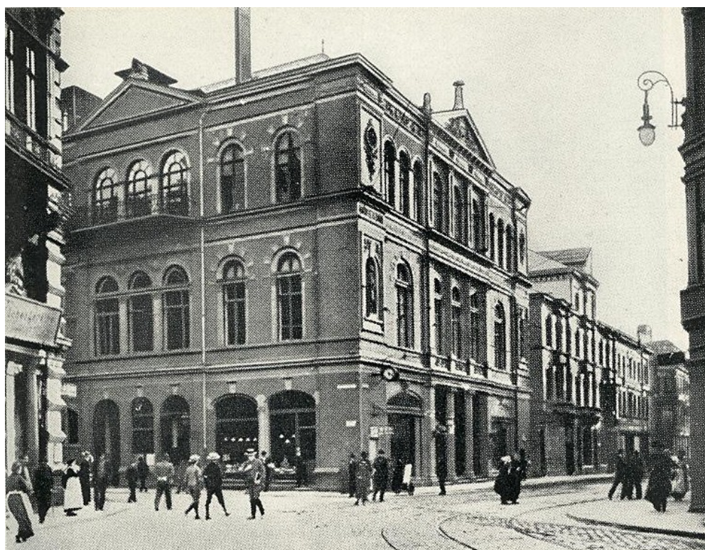
altes Barmer Stadttheater Ecke Neuer Weg/Fischertaler Straße